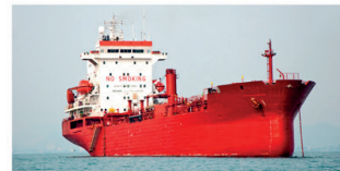
oil tanker petrolier