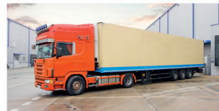
lorry (USA truck) camió